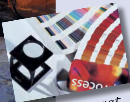
advies op maat