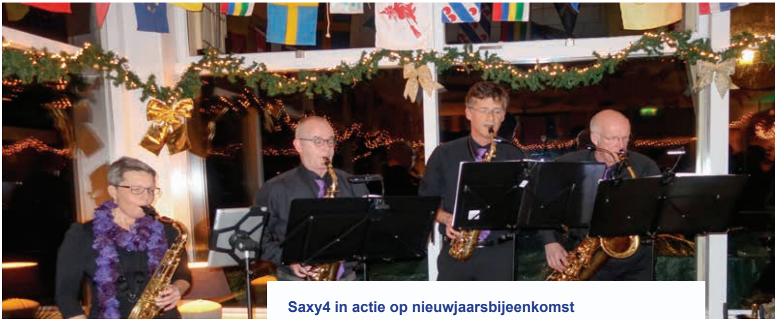
Saxy4 in actie op nieuwjaarsbijeenkomst