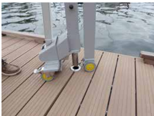
Mobiele tillift voor gebruik op de steiger