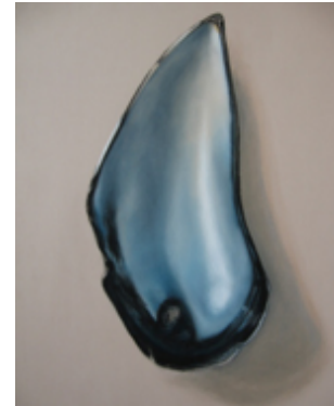
^ "Mossel" van Alyke Evers - www.alyke.nl

Een oude traditie in ere hersteld: Mosselen eten bij Elfhoeven in november